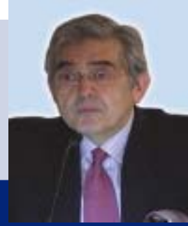
Esteban López-Escobar Presidente Electo de la Wapor